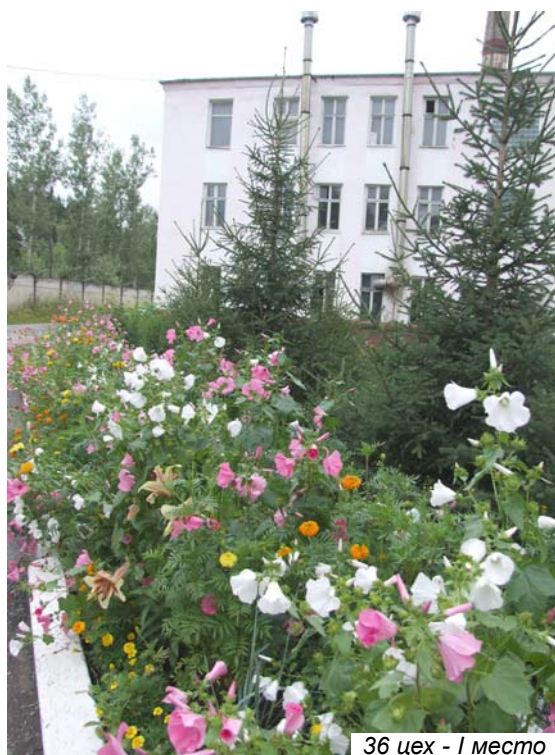
36 цех - место

В этом году бригада цветоводов 46 цеха очень тщательно подобрала ассортимент посадочного материала - цветков к цветку, даже травинки лишней не уберешь, все они декоративные. Оформление просто сказка!