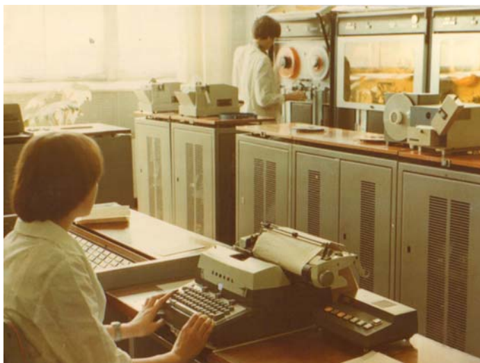
Первая электронно-вычислительная машина "Минск-32"

"ВПК", Информагентства АРМС-ТАСС и Интерфакс-АВН