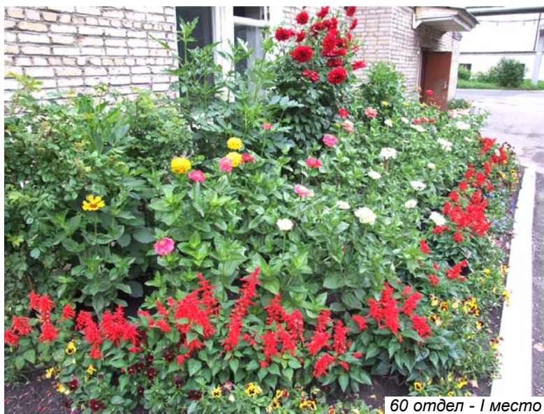
60 отдел - 1 место