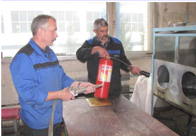
Проверка умения применять первичные средства пожаротушения в цехе 46

вверенных им участков. В результате чего на начальников цехов, где были выявлены грубые нарушения, составлены административные протоколы на сумму от одной до двух тысяч рублей.