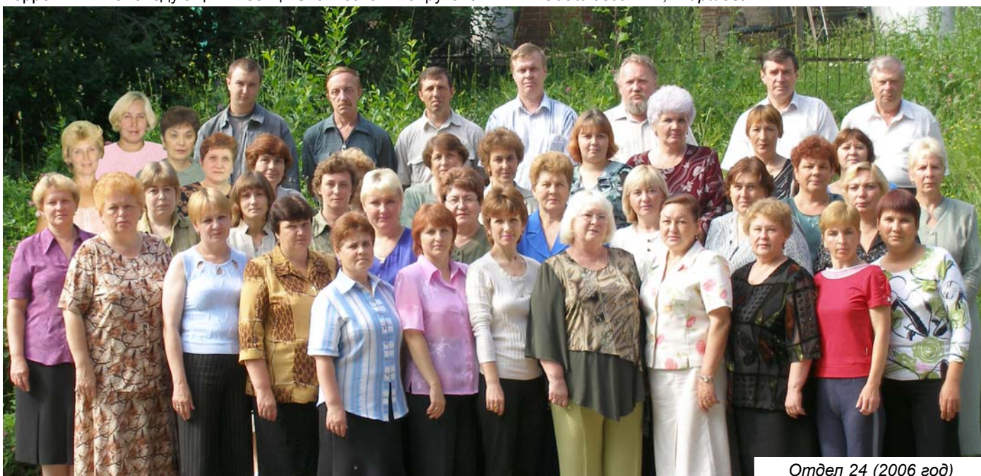
Отдел 24 (2006 год)