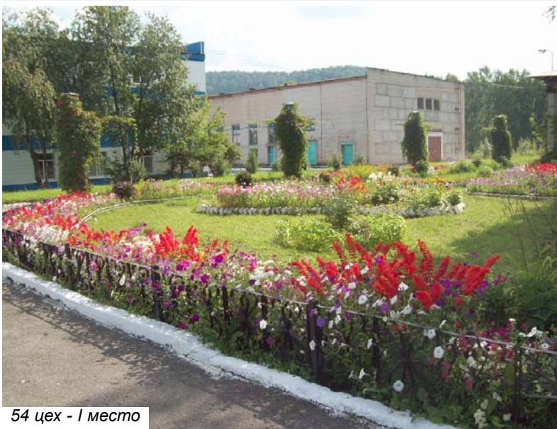
54 цех - 1 место

А эталоном культуры 2009 года стала закреплённая территория 52 цеха. Жаль, правда, что лето было холодным и поэтому бархатцы не захотели стать ярко-оранжевыми, но и в лимонном цвете они тоже очень хороши. Каждый раз, проходя мимо ЦИСа, отмечаешь: "Вот она - прелесть! Не успеваешь отвести один цветок, а на смену ему спешит уже другой".