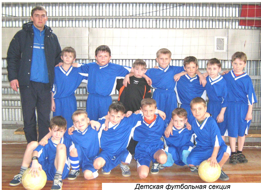
Детская футбольная секция

К работе с детьми в секции футбола приступили трое дипломированных молодых специалистов из города Волгограда. В секции по четырём возрастам занимаются на постоянной основе более 90 мальчиков и юношей. Приобретается новая форма, ветрозащитные костюмы, мячи и другое оборудование. Предусмотрено участие детских и юно-