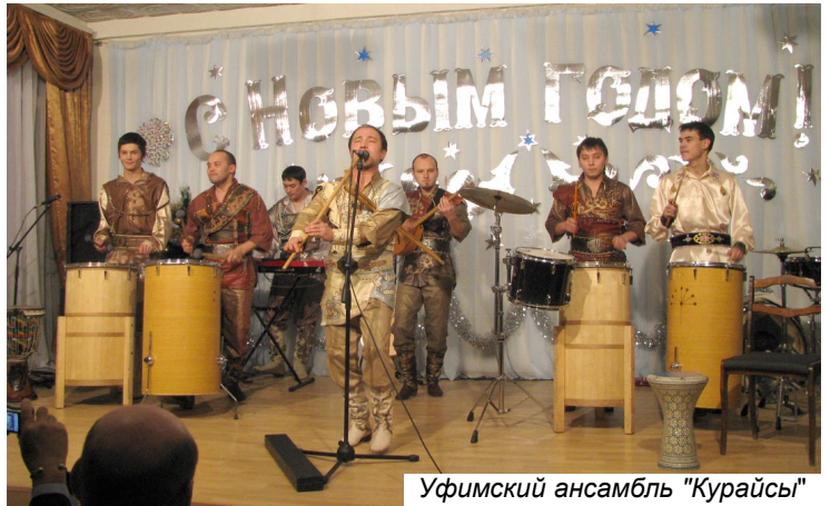
Уфимский ансамбль "Курайсы"